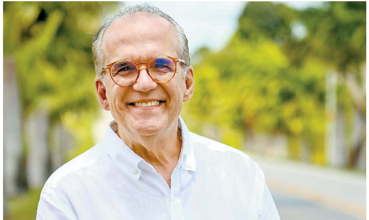
Iniciativa reforça a atuação do parlamentar em defesa da pauta municipalista

“Além de ser parceiro em ações locais importantes para população, sigo trabalhando no plenário e nas comissões nas pautas que