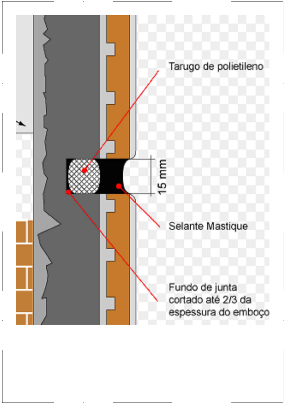
DETALHE JUNTA DE DILATAÇÃO HORIZONTAL NAS FACHADAS SEM ESCALA